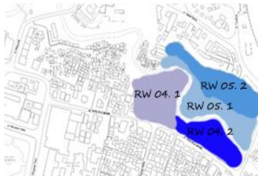
Gambar 2. Lokasi Penilaian berdasarkan Pembagian Zona di Kampung Biru