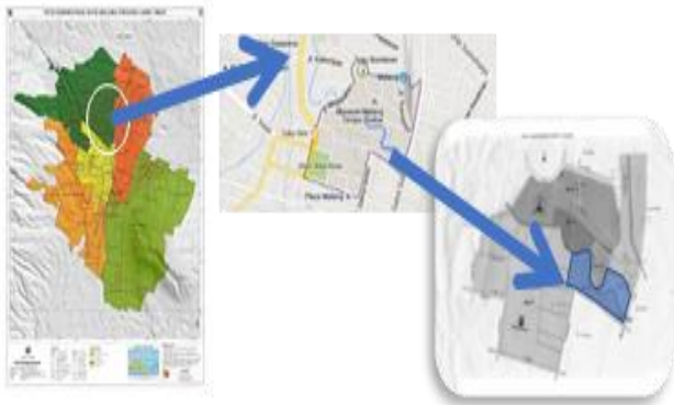
Gambar 1. Kota Malang, Kecamatan Klojen dan Lokasi Kampung Biru Arema

112,07° Bujur Timur dan 7,06° – 8,02° Lintang Selatan, dengan luas wilayah 0.49 km 2 dan ketinggian + 440-667 meter di atas permukaan air laut, seperti pada Gambar 1. Untuk penilaian dibagi Zona Kampung, seperti pada Gambar 2.